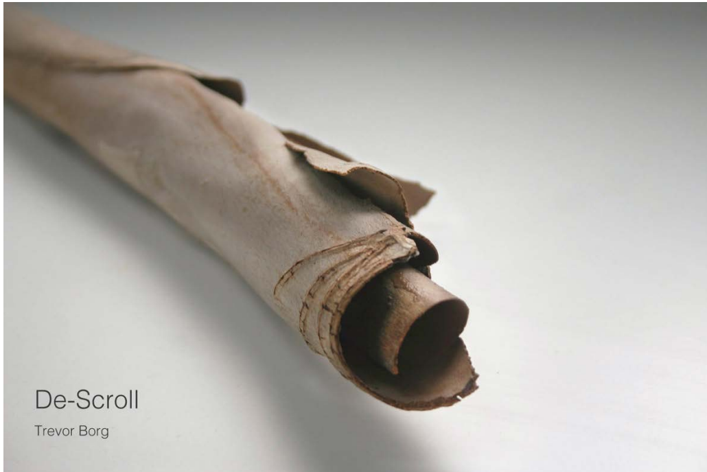
De-Scroll , 2015.